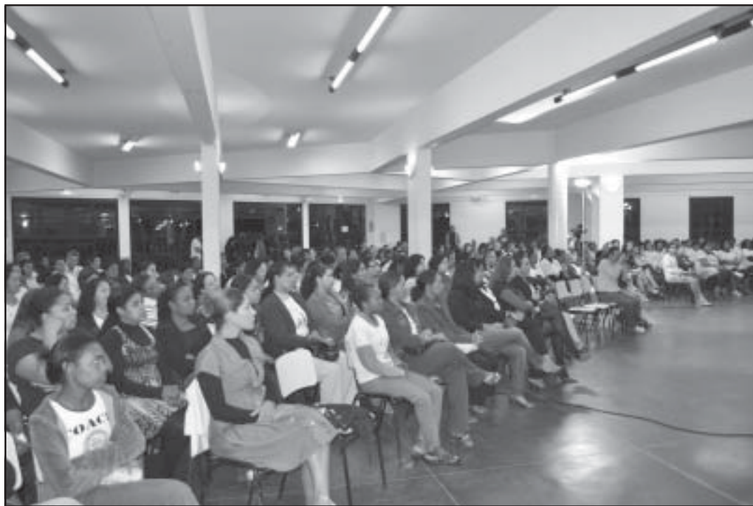
Estudantes recebem certificado dos cursos na próxima quinta-feira, dia 9.

Nesta etapa, o Viva Mulher realizou os cursos de Massas Artesanais, Fabricação de Vassouras de Garrafa Pet, Bolsas e Acessórios Infante Juvenis, Bordados Diversos, Peças íntimas, Corte e Costura, Pinturas e Tela e Tecido, Pani-