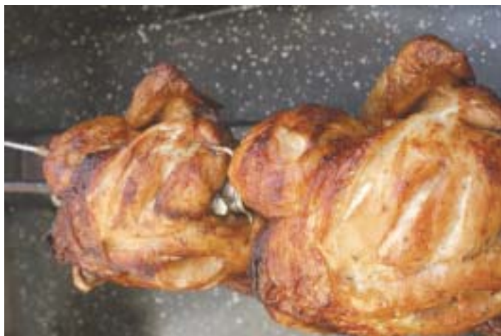
Frango assado virou opção para quem curte o informal happy hour nos fins de tarde.

Terça a domingo, 11h às 22h, dom (20h) (27) 3773-4483