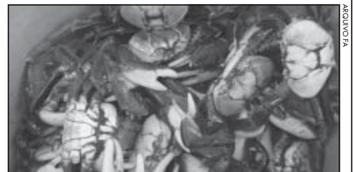
Caranguejo será vendido a R$ 1,99 a unidade.

Serviço: Restaurante Tucanos Rua Mucurici, 219 - Guriri Hoje e amanhã à partir das 11h