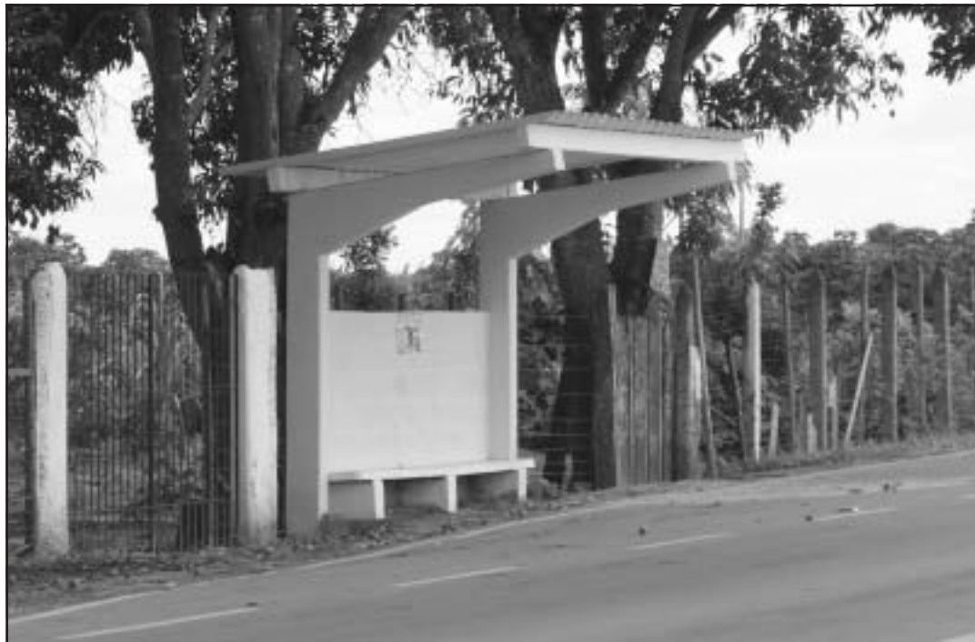
Dez abrigos já foram instalados entre o distrito de Nestor Gomes e o KM 47.