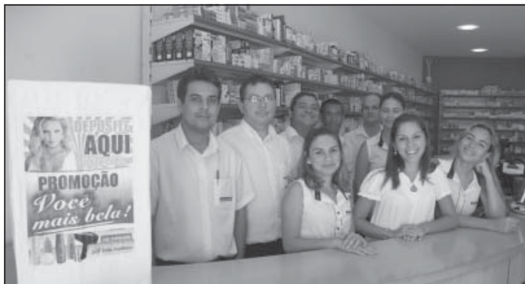
Uma das urnas está na Drogaria São Domingos, de Guriri.