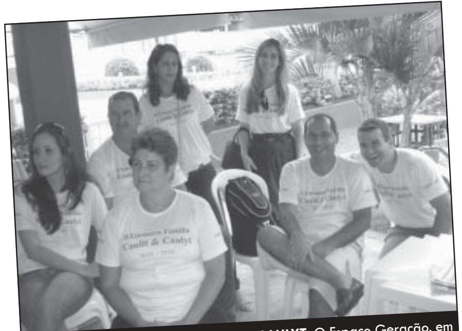
2º ENCONTRO DA FAMÍLIA CAULI & CAULYT: O Espaço Geração, em Vitória, no dia 14 de novembro, foi palco do maravilhoso 2º Encontro da Família Cauli & Caulyt. Na foto, alguns descendentes desta importante família.

Mande notícias, dicas e sugestões: mesigna@terra.com.br