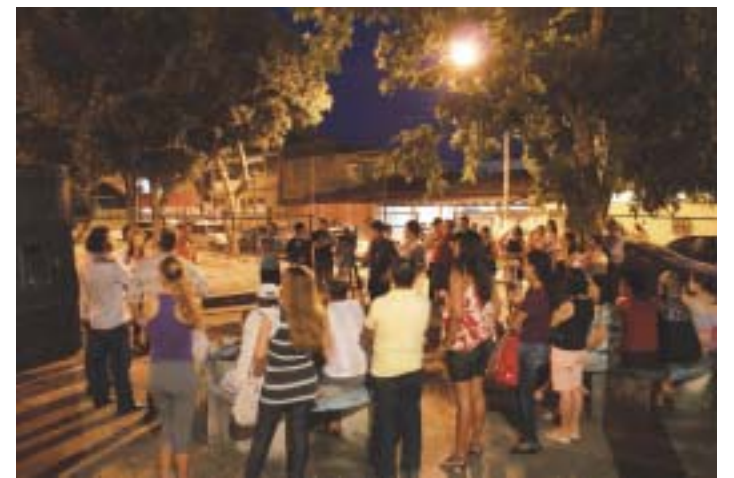
Durante evento moradores pedem reforma da praça.