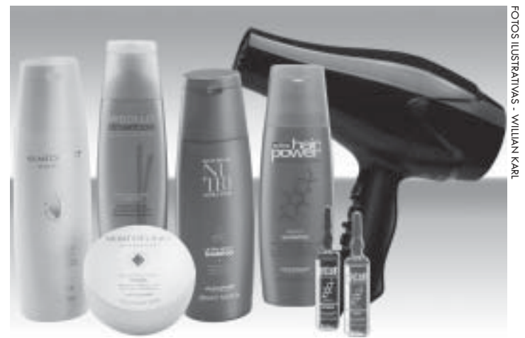
Kit da linha Alfaparf para o cabelo e secador serão sorteados

A promoção é uma realização da Folha Acadêmica com apoio da Drogaria São Domingos. Recorte seu cupom e participe! Você Mais Bela vai deixar você leitor, ainda mais bela (o) neste fim de ano! Participe! Cupom na página 04.