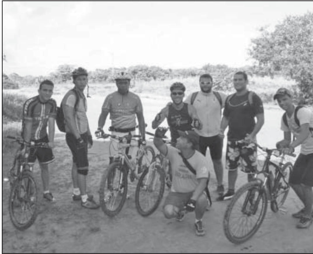
A concentração inicia às 6h30, com largada às 8h.