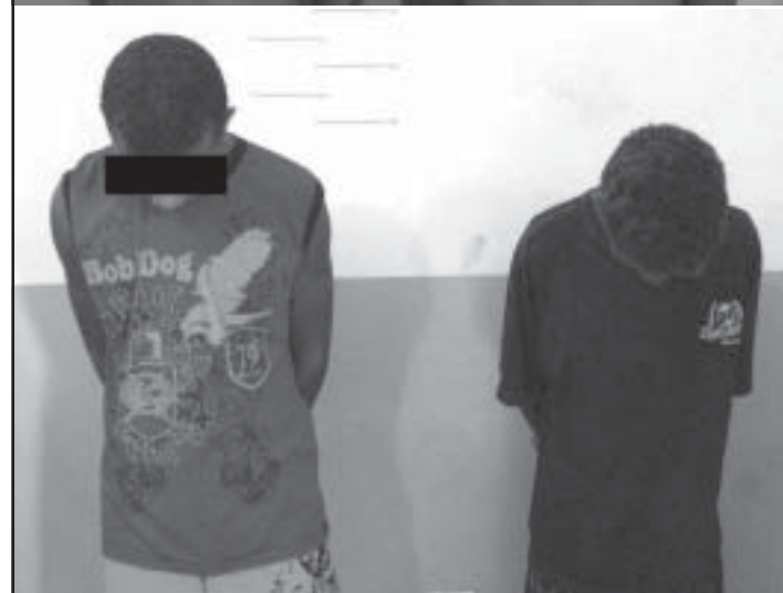
Os dois menores W.S.S de 15 anos e T.M.S, de 16, também foram detidos.

tre eles dois menores, porém com eles nada foi encontrado.