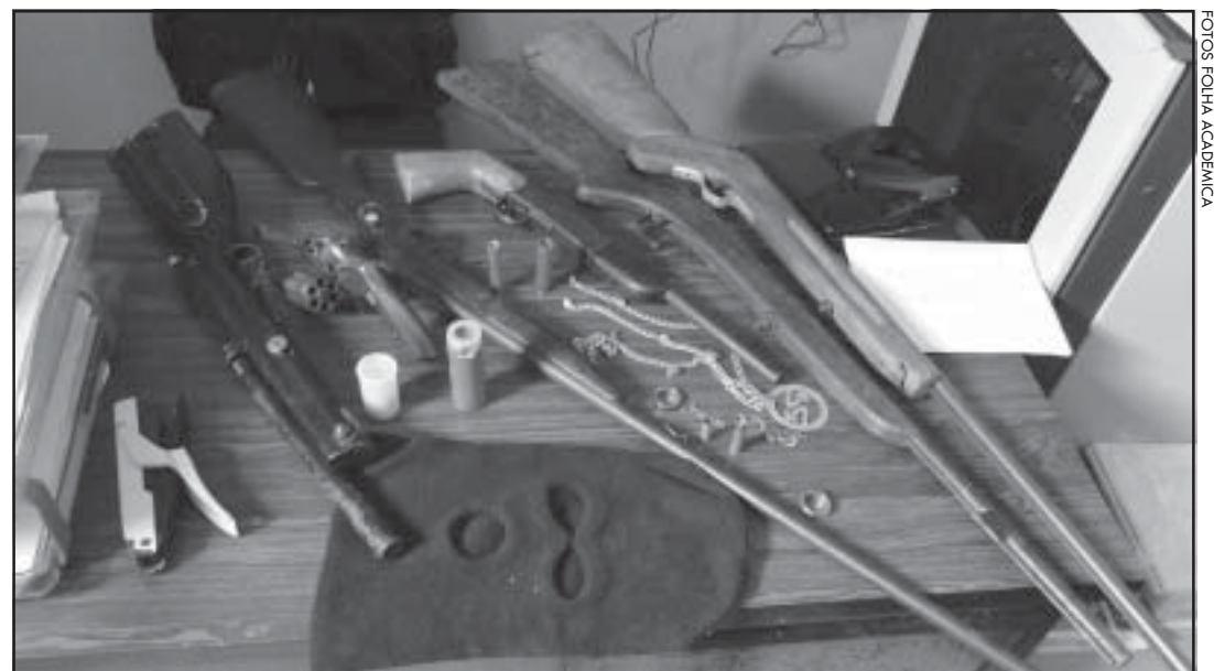
Armamento, maconha dentro de frasco e touca preta foram encontrados na residência.

Após revista na residência de Claudiomar, a polícia