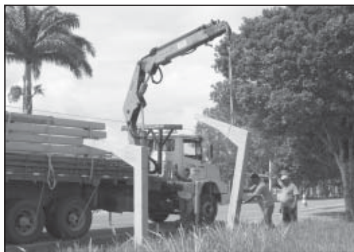
Projeto tem previsão de término no próximo mês.

Ao ser mencionada a inclusão de abrigos em Guriri e na Rodovia Othovarino Duarte Santos, o secretário esclarece que a obra é de responsabilidade da Viação São Gabriel e que a prefeitura está cobrando a empresa encarregada pelo transporte coletivo em São Mateus, para as devidas melhorias.