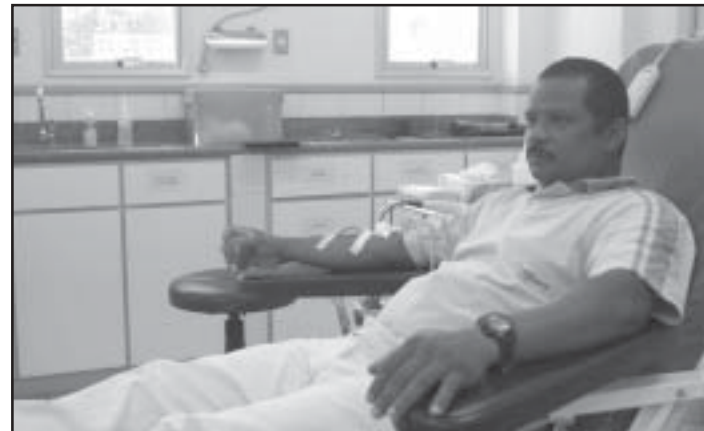
Hemocentro recebe em média 300 doadores mensais.