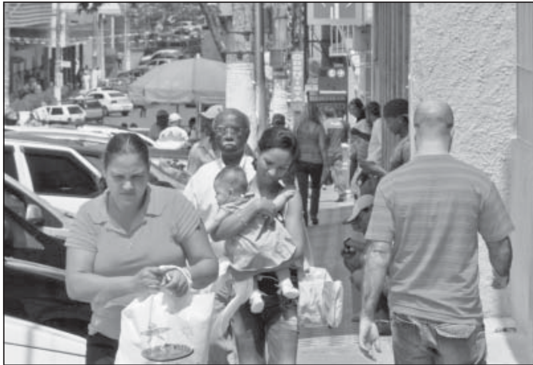
Em São Mateus, 77,5% da população vive na zona urbana.

O censo apurou 42.929 domicílios de São Mateus. De acordo com o IBGE, em abril de 2011 serão divulgadas as características gerais da população, com relação à faixa etária, renda familiar e escolaridade.