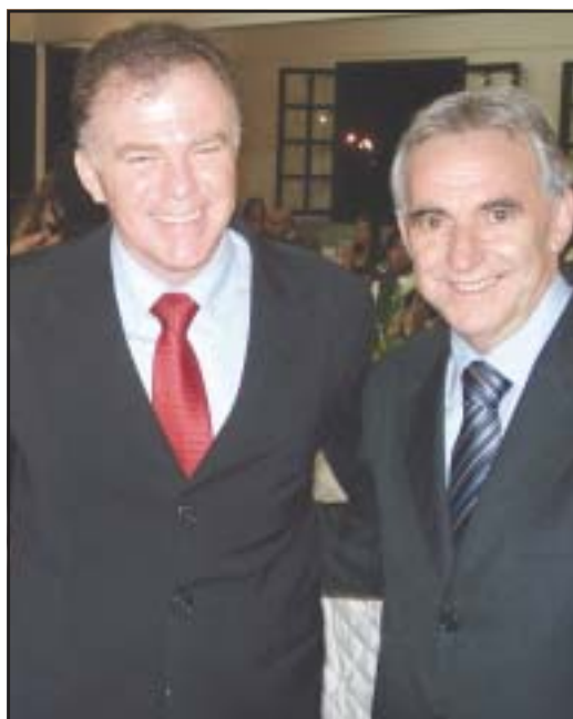
BÊNÇÃOS: Vai para o nosso ilustre Governador eleito José Renato Casagrande, aniversariante de sexta-feira, que divide a foto com o nosso, também, ilustre Prefeito Amadeu Boroto, as mais caras bênçãos do GLORIOSO São Mateus.